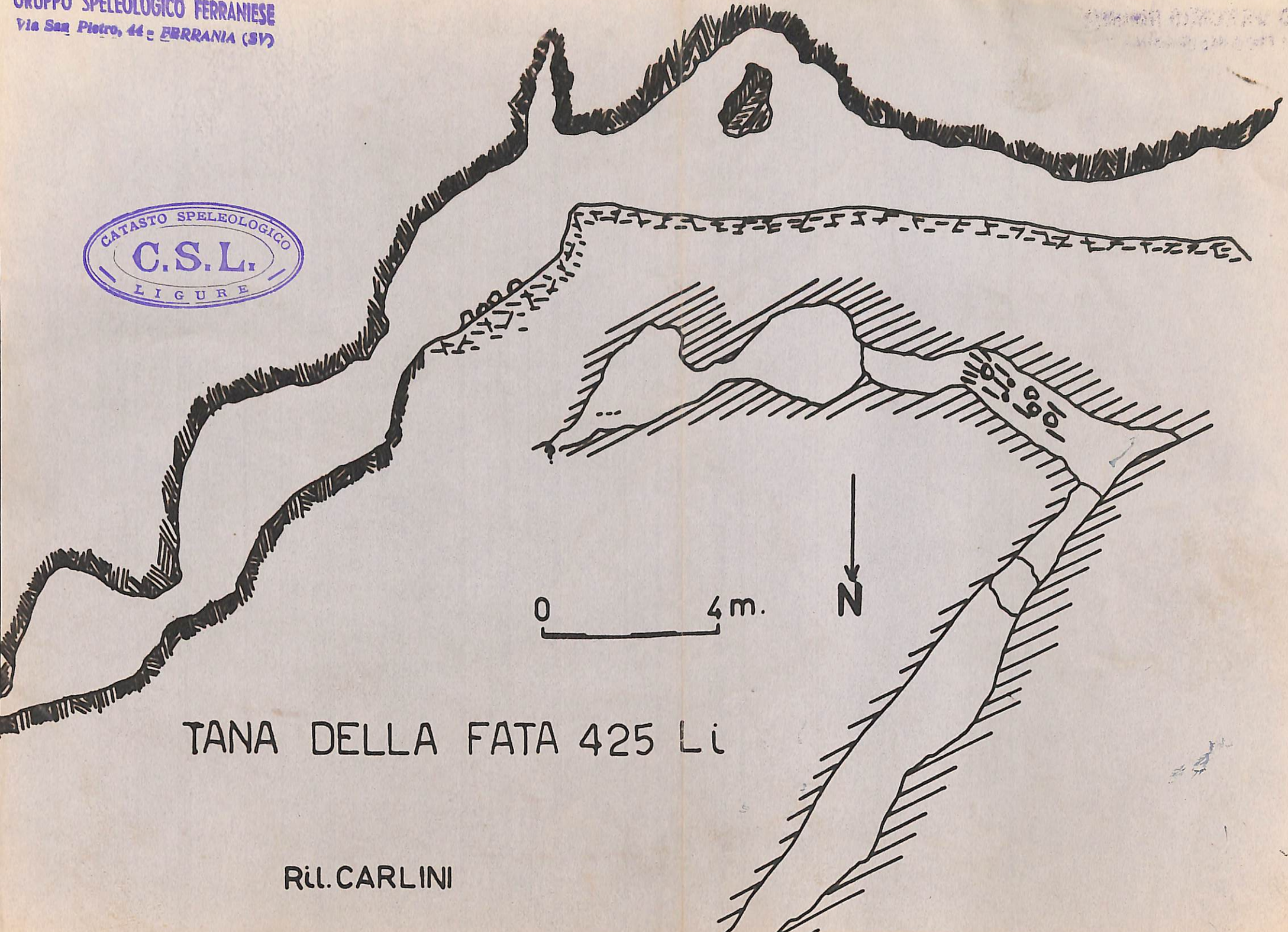
TANA DELLA FATA 425 Li