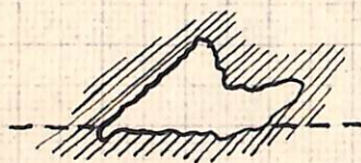
imbocco visto dal davanti