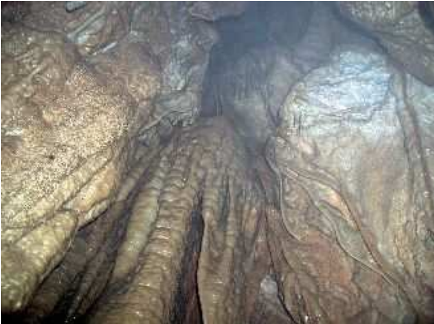
Tana da' Dragunea - Risalita concrezionata sul lago

Oltre la sala sulla destra la galleria continua allagata fino a stringere in un passaggio alto e stretto percorso dall'acqua.