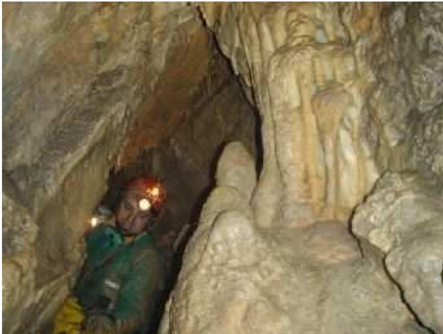
Tana da' Dragunea - ramo nuovo