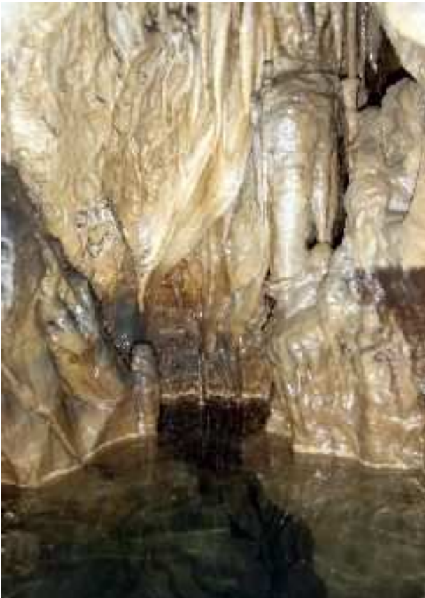
Tana da Dragunea - una delle vaschette