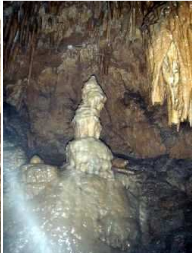
Tana da Dragunea - torre di pisa